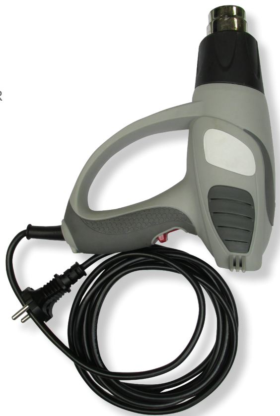
Décapeur thermique ou chalumeau à flamme orange mais pas de lampe à souder avec un dard bleu