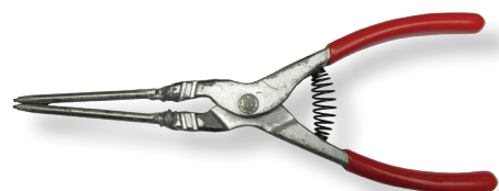
600051 - Pince à circlips