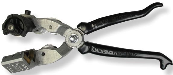
600620 - Pince à dénuder de type ALROC PINTEL 4BT/12_16R